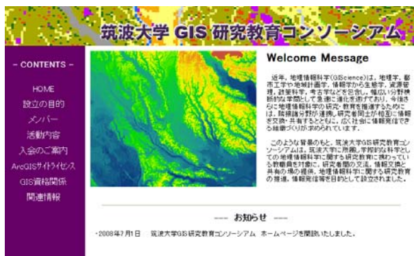
図7 「筑波大学 GIS 研究教育コンソーシアム」のホームページ

さらに ArcGIS サイトライセンスをはじめ、GIS ソフトウェアの入手方法、使用方法について解説するとともに、E-Learning 等による学習支援、学習情報の提供を行う。(3) 情報交換・交流の場の提供 研究会、フォーラム、交流会、シンポジウム、懇親会等の開催により、異なる学問分野を専攻する研究者間の交流を図る。(4) 社会貢献 市民向けのイベント、フォーラム等を通じて、地理情報科学の認知度を向上させ、地域社会への情報発信、市民参加を促進する。