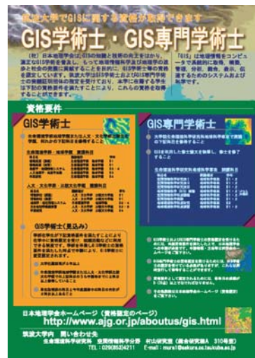
図8 筑波大学における GIS 学術士と GIS 専門学術士の取り組み

学生は大学に設置されている科目を自由に選択することができ、学際性が有効に働くからである。