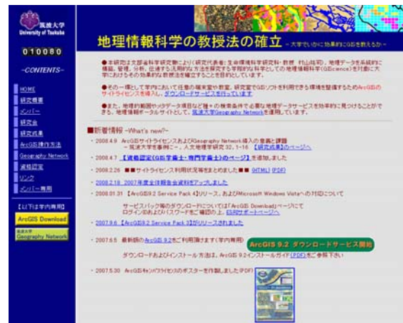
図1 「地理情報科学の教授法の確立」のホームページ