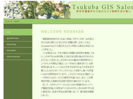
図9 つくば GIS サロンのホームページ

( http://www.gis-ibaraki.or.jp/ )。今年度から、茨城県は統合型 GIS の本格運用に取りかかっており、この法人にはセミナーやワークショップなどを通じて、県庁職員や市町村職員、そして民間企業との橋渡しが期待される。大学は、これらの組織に積極的に関わり、研究教育、啓蒙活動の拠点となることが望まれる。