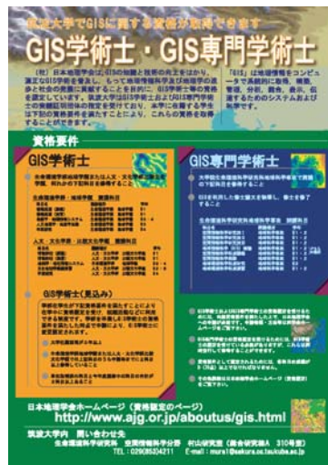
図8 筑波大学における GIS 学術士と GIS 専門学術士の取り組み

学生は大学に設置されている科目を自由に選択することができ、学際性が有効に働くからである。