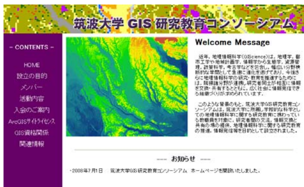
図7 「筑波大学 GIS 研究教育コンソーシアム」のホームページ

さらに ArcGIS サイトライセンスをはじめ、GIS ソフトウェアの入手方法、使用方法について解説するとともに、E-Learning 等による学習支援、学習情報の提供を行う。(3) 情報交換・交流の場の提供 研究会、フォーラム、交流会、シンポジウム、懇親会等の開催により、異なる学問分野を専攻する研究者間の交流を図る。(4) 社会貢献 市民向けのイベント、フォーラム等を通じて、地理情報科学の認知度を向上させ、地域社会への情報発信、市民参加を促進する。