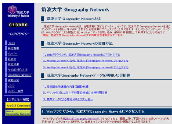
図2 筑波大学 Geography Networkポータルサイトのホームページ

筑波大学ではGeography Networkポータルサイトを構築し、統計、デジタル地図、授業で利用する空間データなどを学生に無償で提供する体制を敷いている(図2)。