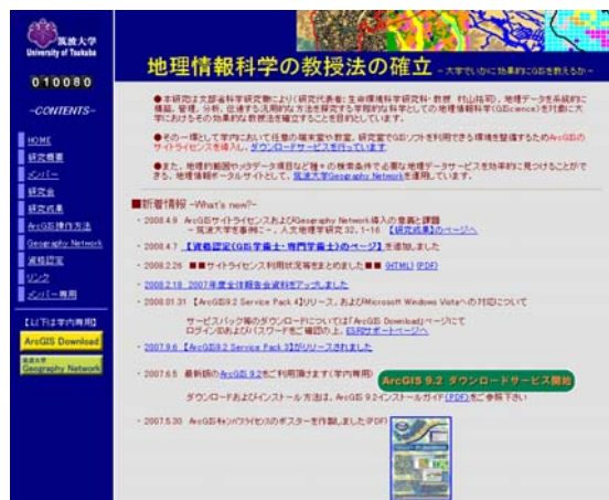
図1 「地理情報科学の教授法の確立」のホームページ