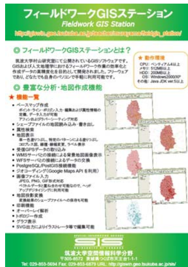
図 5 フィールドワーク GIS ステーション

また、当分野では、GIS を活用したフィールドワークの研究を進めている。学生の地域調査を支援する「フィールドワーク GIS ステーション」を構築し、野外実習でその有効性の実証実験を行っている (村山ほか, 2008)。